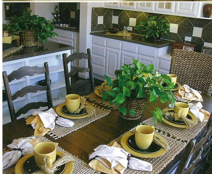
(写真は使用イメージです)